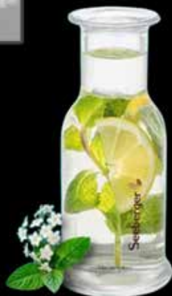
Bio Holunder & Zitronenmelisse