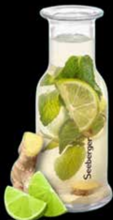
Bio Ingwer- Minze- Limette